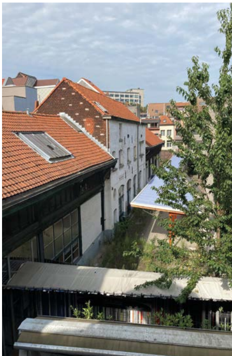
Het pakhuis aan de Leguit

“Een renovatie was echt wel nodig,” zegt Frederik. “Het gebouw was in erbarmelijke staat. Een slechte isolatie, ramen van enkel glas, in de winter te